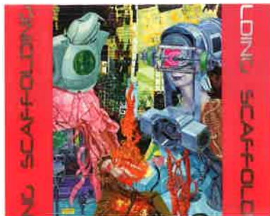
M - SCAFFOLDING - 油彩、コラージュ、金箔、白亜下地、綿布、パネル 91.0cm×116.7cm、2018年