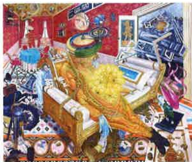
物流 油彩、白亜下地、綿布、パネル 162.0cm×194.0cm、2020年

1983年山形県生まれ、2005年筑波大学芸術専門学群卒業、「芸大・茨大・筑波大卒業修了制作選抜展」出品、2006年トウキョーワンダーシート2006(トウキョーワンダーサイト)出品、2010年筑波大学大学院人間総合科学研究科博士後期課程芸術専攻修了、2010～2012年文化庁新進芸術家海外研修制度によりイタリアのフィレンツェに滞在、2013年第16回岡本太郎現代芸術賞展(川崎市岡本太郎美術館)出品、2015年個展「記憶の劇場」(佐藤美術館)、2017年個展(ギャラリー広田美術)、2018年個展(最上川美術館)、みちのおくの芸術祭山形ビエンナーレ2018出品、2019年個展(ギャラリー広田美術)、2022年東北画は可能か? 生々世々 (kaikai kiki gallery)