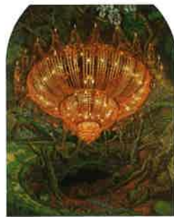
ルクス 油彩、白亜下地、綿布、パネル 126.0cm×100.0cm、2010年