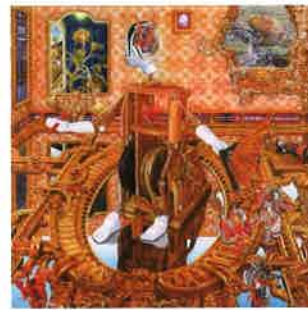
ある星の稽古場 油彩、白亜下地、綿布、パネル 91.0cm×91.0cm、2021年