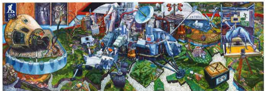
記憶のジオラマ 油彩、白亜下地、綿布、パネル 182.0cm×520.0cm、2015年