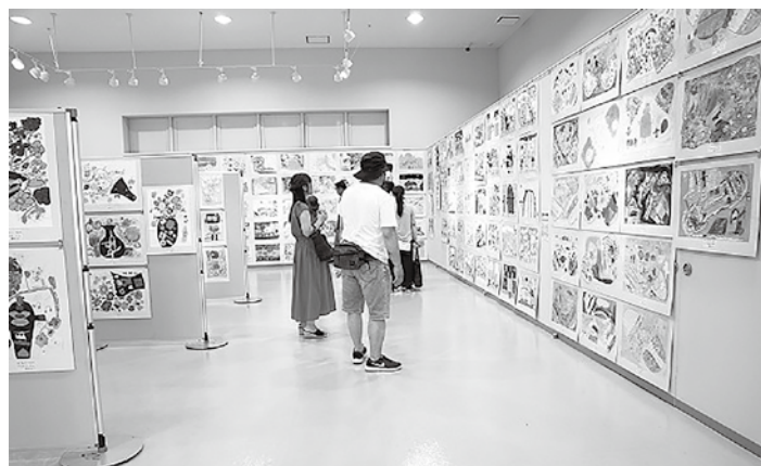
▲令和元年度の会場風景（2年生）

心の豊かさがとねえられる一方、義務教育における情操教育の時間は減少する傾向にあります。その少ない時間の中でも、現代社会に対応できる柔軟な感性や力を育むべく、学校ではさまざまな取り組みが行われています。子どもたちが豊富な題材やテーマで制作した作品を通して、図工教育の現在をご覧ください。