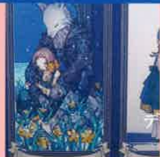
デザイン / 仙波歩美