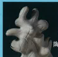
陶芸 / 千葉洸里