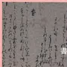
書 / 登坂百香