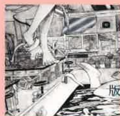
版画 / 鐘翊綺