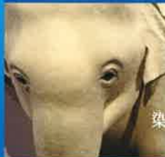
染織 / 杉谷亜佳里