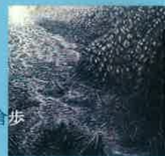
洋画 / 名倉歩