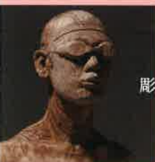
彫刻 / 古場勇士