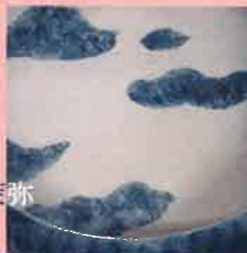
陶芸 / 藤井茉莉