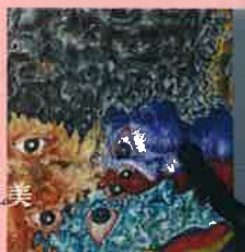
洋画 / 石田礼美