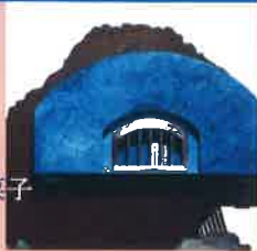
彫金 / 白木香菜子