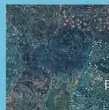
日本画 / 大畑真梨絵

2021年4月25日(日) - 5月8日(土) 10:00 - 19:00 (最終日は13:00終了) 会期中無休 / 入場無料