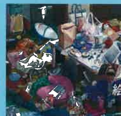
絵画 / 塩畑綾香