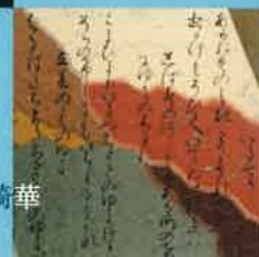
書 / 笠原綺華