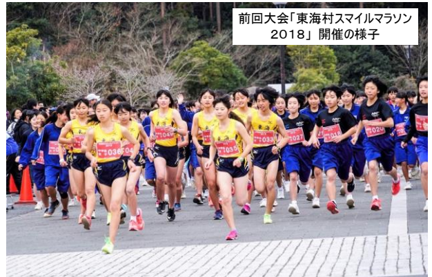
前回大会「東海村スマイルマラソン 2018」開催の様子

◆会場 東海村総合福祉センター「絆」(スタート・ゴール) および 周辺道路(私道・村道) ※「駅東大通り」の一部を使用します。